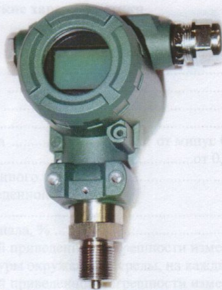
Рисунок 4- Общий вид преобразователей давления измерительных ОВЕН ПД100-ДИ, -ДА, -ДВ со встроенной индикацией