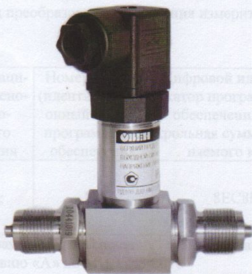
Рисунок 3- Общий вид преобразователей давления измерительных ОВЕН ПД100-ДД