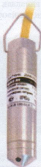
Рисунок 2- Общий вид преобразователей давления измерительных ОВЕН ПД100 –ДГ