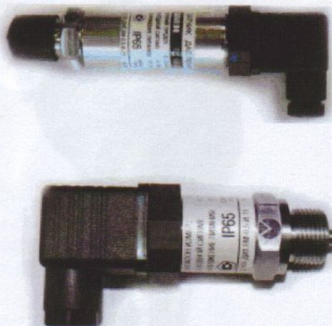
Рисунок 1-Общий вид преобразователей давления измерительных ОВЕН ПД100 -ДИ, -ДА, -ДВ (без встроенной индикации)