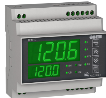
Исполнение с типом входа и исполнением индикации У3