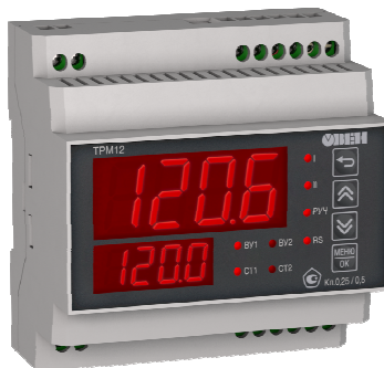
Исполнение с типом входа и исполнением индикации У2