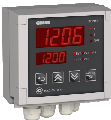
Исполнение с типом входа и исполнением индикации У2