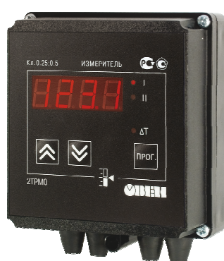
Исполнение с типом входа и исполнением индикации У

Нанесение знака поверки на приборы в обязательном порядке не предусмотрено. Пломбирование приборов не предусмотрено.