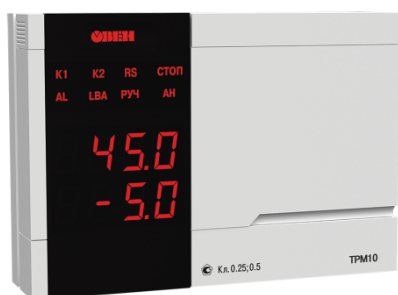
Исполнение с типом входа и исполнением индикации У2