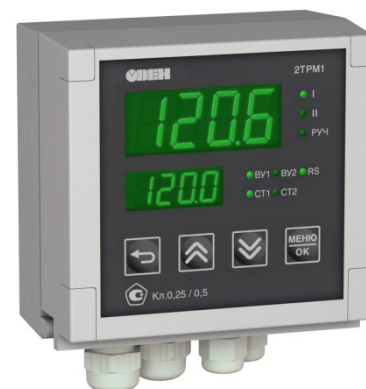
Исполнение с типом входа и исполнением индикации У3