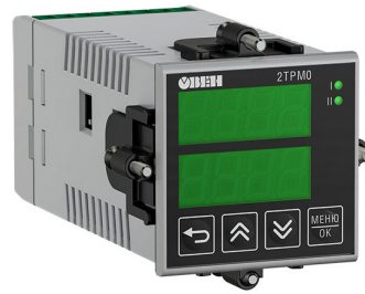
Исполнение с типом входа и исполнением индикации У3