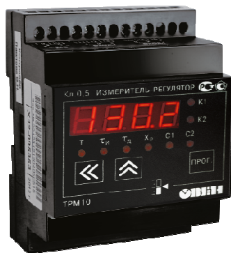
Исполнение с типом входа и исполнением индикации У