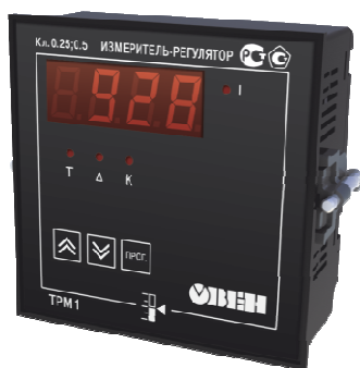
Рисунок 5 – Общий вид измерителей-регуляторов микропроцессорных 2TRM0, 2TRM1, TRM1, TRM10, TRM12 в корпусе типа Щ1