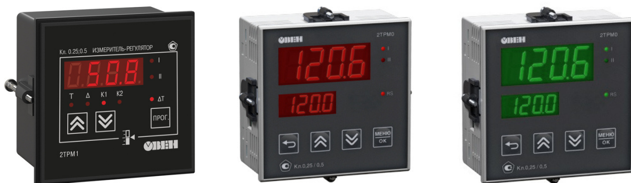
Исполнение с типом входа и исполнением индикации У