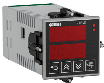
Исполнение с типом входа и исполнением индикации У2