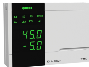
Исполнение с типом входа и исполнением индикации У3