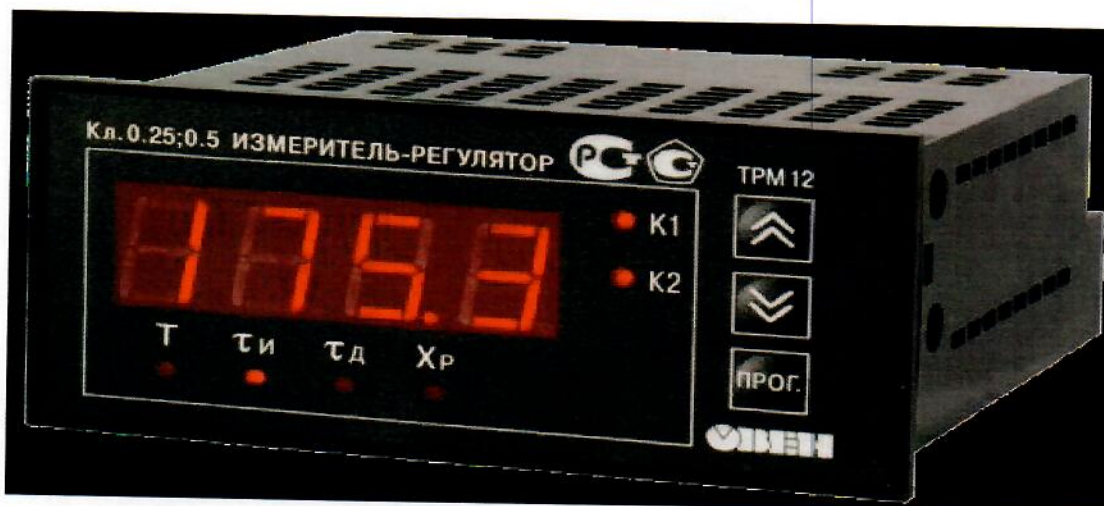
Рисунок 4. Общий вид измерителя в корпусе Щ2 – для щитового крепления