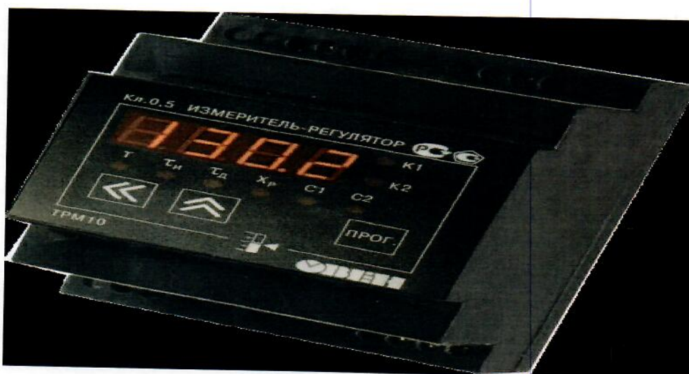
Рисунок 5. Общий вид измерителя в корпусе Д – для крепления на DIN-рейку