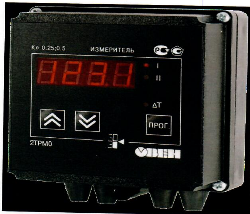
Рисунок 1. Общий вид измерителя в корпусе Н – для настенного крепления

Общий вид измерителей приведены на Рисунках 1-5.