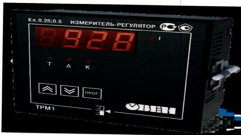
Рисунок 3. Общий вид измерителя в корпусе Щ11 – для щитового крепления