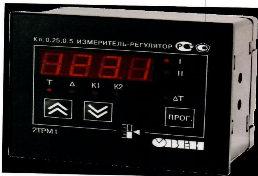
Рисунок 2. Общий вид измерителя в корпусе Щ1 – для щитового крепления