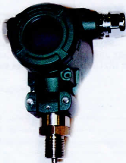
Рисунок 4 - Общий вид преобразователей давления измерительных ОВЕН ПД100И -ДИ, -ДА, -ДВ (со встроенной индикацией)