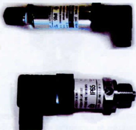
Рисунок 1 - Общий вид преобразователей давления измерительных ОВЕН ПД100И -ДИ, -ДА, -ДВ (без встроенной индикации)

Конструкция преобразователей, за счет сварных соединений обеспечивает ограничение доступа к внутренним элементам, влияющим на метрологические характеристики, и не требует пломбирования.