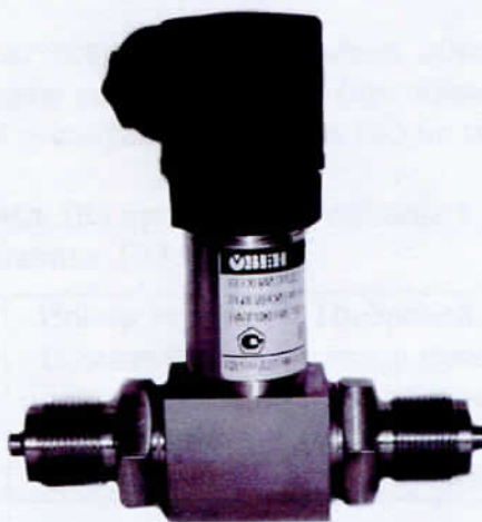
Рисунок 3 - Общий вид преобразователей давления измерительных ОВЕН ПД100И-ДД