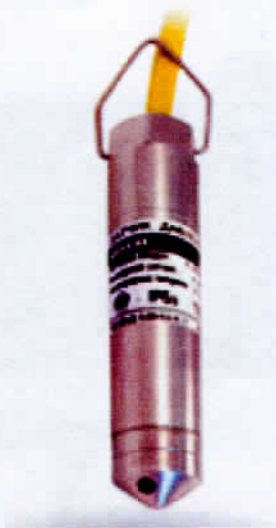
Рисунок 2 - Общий вид преобразователей давления измерительных ОВЕН ПД100И-ДГ