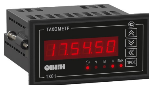
Рисунок 3 - Общий вид счетчиков в корпусе для щитового (Щ2) крепления

Пломбирование счетчиков не предусмотрено.