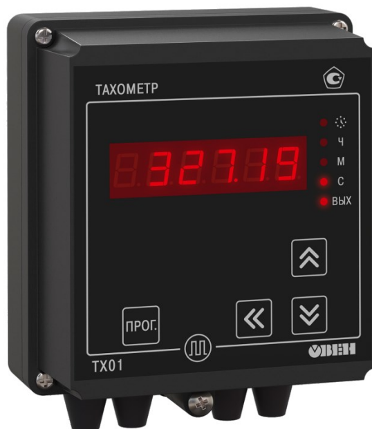
Рисунок 2 - Общий вид счетчиков в корпусе для настенного (Н) крепления