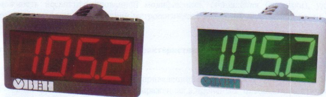
Рис. 1. Общий вид приборов со стороны передней панели

Фотография общего вида приборов приведена на рисунках.