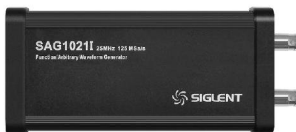
Программно-аппаратная опция внешнего модуля функционального генератора (SAG1021I).