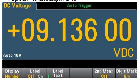
Формат индикации 6 1/2