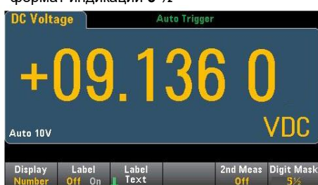
формат индикации 5 1/2