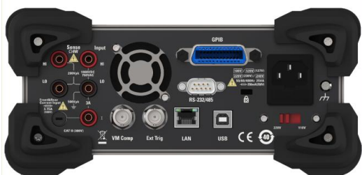
Вид задней панели (с опцией 11)