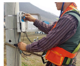
Использование ремня на столбе