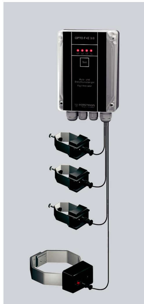
Полный комплект OPTO-F+E 3.0