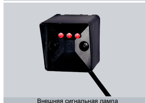
Внешняя сигнальная лампа