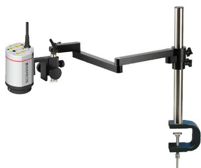
Штатив шарнирный с фокусирующим модулем