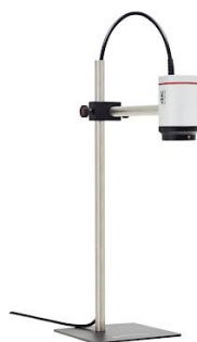
Штатив настольный для микроскопа с РД 500мм