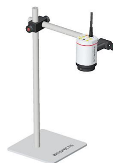
Штатив настольный для микроскопа с РД 500мм и с адаптером для бокового положения микроскопа