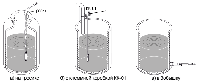
Рисунок 2 – Примеры монтажа на объекте

Для более удобного монтажа преобразователя рекомендуется использовать клеммную коробку КК-01 производства фирмы OWEN. Клеммная коробка позволяет зафиксировать преобразователь на вертикальной плоскости или вертикальной трубе, а также выполнить стыковку сигнального кабеля с капилляром преобразователя с обычным сигнальным кабелем внешних устройств. Клеммная коробка КК-01 доступна по отдельному заказу.