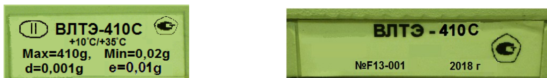
Рисунок 4 – Маркировка весов

Маркировка весов выполняется на двух табличках (рисунок 4) и содержит следующие сведения: модификация весов; максимальная нагрузка (Max); минимальная нагрузка (Min); действительная цена деления (d); поверочное деление (e); класс точности весов; знак утверждения типа; заводской номер весов; год изготовления; предельные значения температуры.