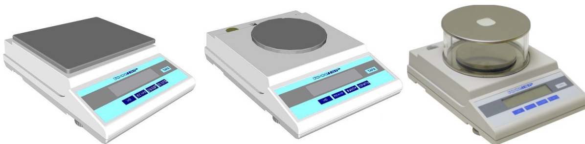
Рисунок 1 – Общий вид весов

По дополнительному заказу весы могут комплектоваться стандартным интерфейсом RS-232C.