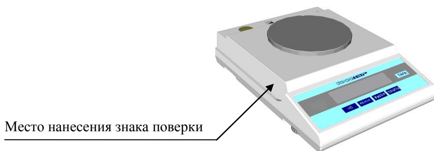
Рисунок 3 – Обозначение места нанесения знака поверки