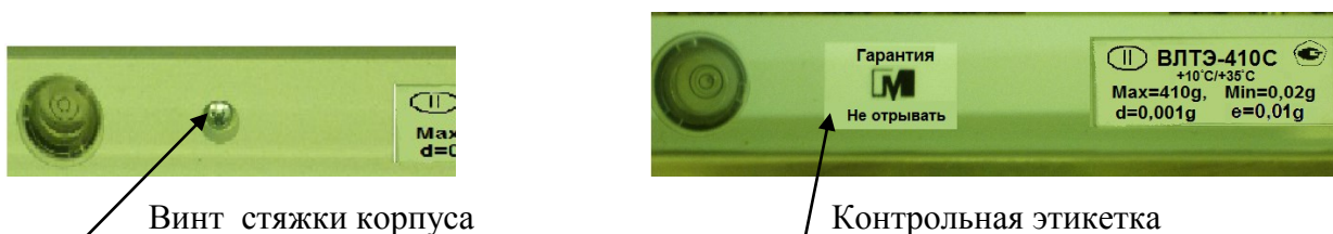
Рисунок 2 - Схема пломбирования от несанкционированного доступа

Для защиты весов от несанкционированной настройки и вмешательства, которые могут привести к искажению результатов измерений, весы пломбируются поверх одного винта стяжки корпуса контрольной этикеткой изготовителя. Схема пломбирования и обозначение места нанесения знака поверки представлены на рисунках 2 и 3, соответственно.