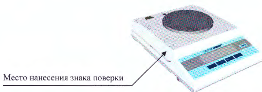
Рисунок 3 – Обозначение места нанесения знака поверки