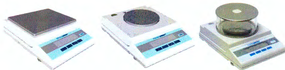
Рисунок 1 – Общий вид весов

По дополнительному заказу весы могут комплектоваться стандартным интерфейсом RS-232C.