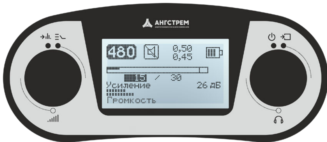
Рис. 1 – Передняя панель приемника ПП-500К

*** – минимальная полоса пропускания в процентах к центральной частоте в режиме Узкая Полоса (УП).