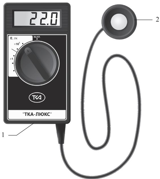
Рис.1 Внешний вид прибора “ТКА-Люкс”