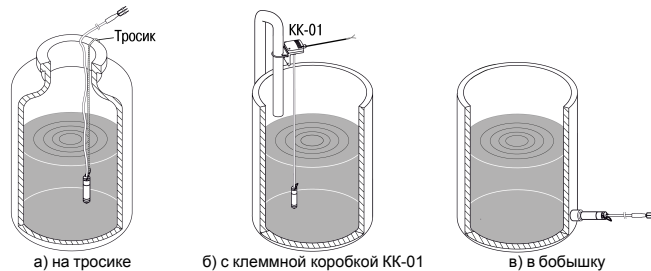
Рисунок 2 – Примеры монтажа на объекте

Для более удобного монтажа преобразователя рекомендуется использовать клеммную коробку КК-01 производства фирмы ОВЕН. Клеммная коробка позволяет зафиксировать преобразователь на вертикальной плоскости или вертикальной трубе, а также выполнить стыковку сигнального кабеля с капилляром преобразователя с обычным сигнальным кабелем внешних устройств. Клеммная коробка КК-01 доступна по отдельному заказу.