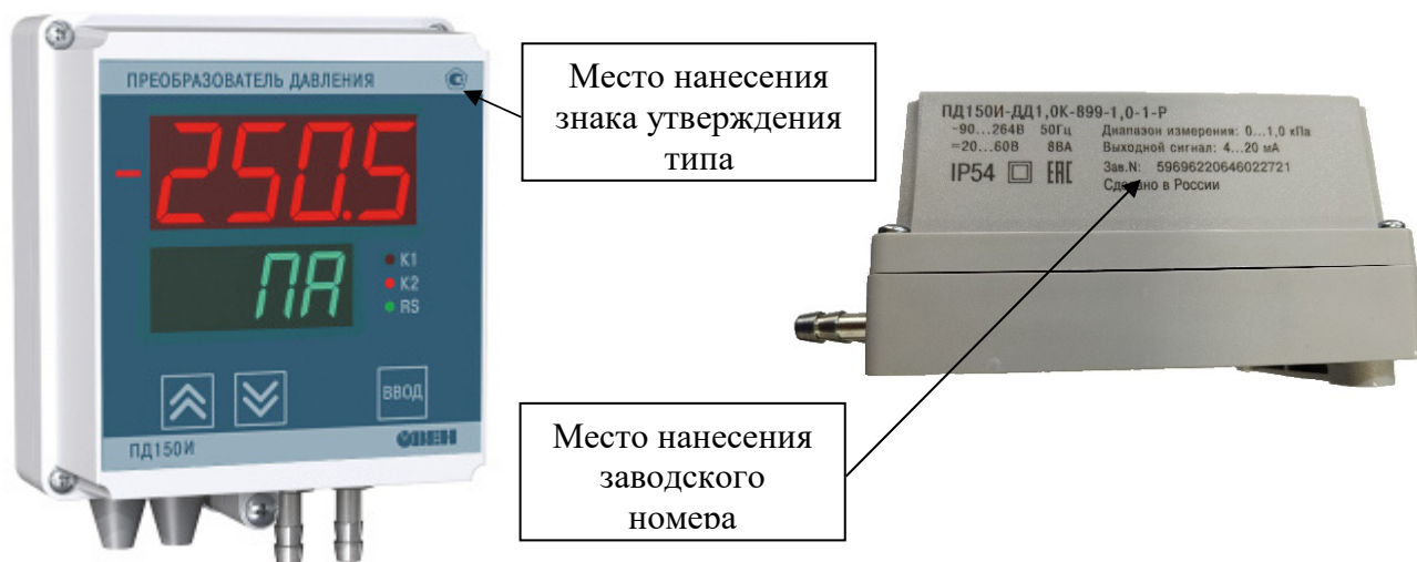
Рисунок 3 - Общий вид преобразователей давления ПД150И с типом корпуса 899 (настенное крепление)