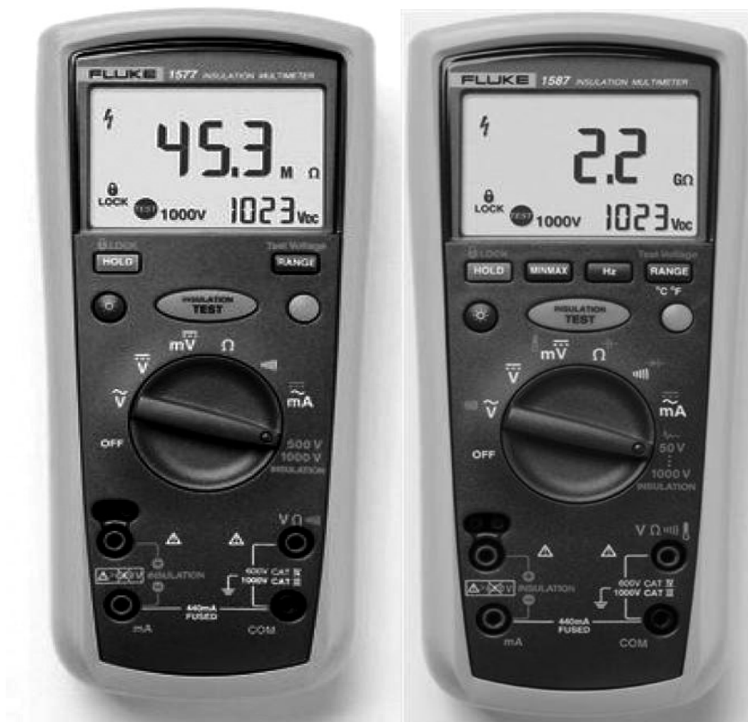
Рисунок 1 - Внешний вид мультиметров – мегаомметров Fluke 1577 (слева) и Fluke 1587 (справа).

Конструктивно мультиметр выполнен в ударопрочном пылезащитном корпусе и представляет собой портативный цифровой прибор. Внешний вид мультиметров представлен на рисунке 1.